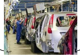
ورشة لصناعة السيارات